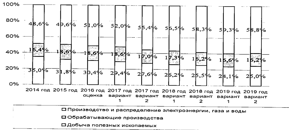
Рис. 1. Структура промышленного производства в 2014-2019 годах

В структуре промышленного производства в 2015 году преобладает производство и распределение электроэнергии, газа и воды – 49,6%, добыча полезных ископаемых – 31,8%, обрабатывающие производства – 18,6%.