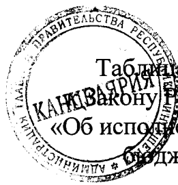
Таблица 1 приложения 18 к Закону Республики Ингушетия «Об исполнении республиканского бюджета за 2019 год»