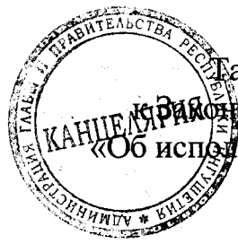
Таблица 1 приложения 15 к Закону Республики Ингушетия «Об исполнении республиканского бюджета за 2019 год»