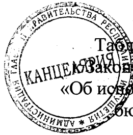
Таблица 1 приложения 13 Закона Республики Ингушетия «Об исполнении республиканского бюджета за 2019 год»