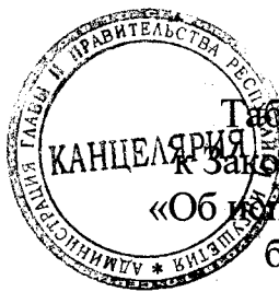
Таблица 1 приложения 17 к Закону Республики Ингушетия «Об исполнении республиканского бюджета за 2019 год»