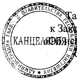
Таблица 2 приложения 3