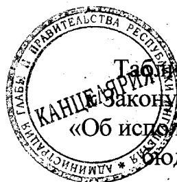
Таблица 1 приложения 12 Закону Республики Ингушетия «Об исполнении республиканского бюджета за 2019 год»