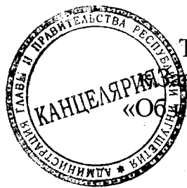
Таблица 1 приложения 2 к Закону Республики Ингушетия «Об исполнении республиканского бюджета за 2019 год»