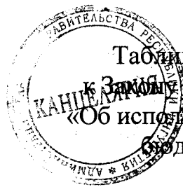
Таблица 1 приложения 16 к Закону Республики Ингушетия «Об исполнении республиканского бюджета за 2019 год»