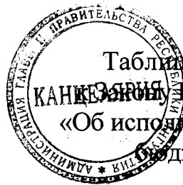
Таблица 2.1 приложения 6 Закон Республики Ингушетия «Об исполнении республиканского бюджета за 2019 год»