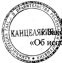
Таблица 1.1 приложения 6 Закона Республики Ингушетия «Об исполнении республиканского бюджета за 2019 год»