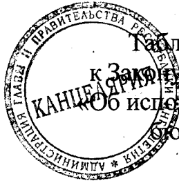
Таблица 1 приложения 8 к Закону Республики Ингушетия «Об исполнении республиканского бюджета за 2019 год»