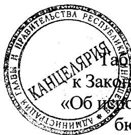
Таблица 1 приложения 4 к Закону Республики Ингушетия «Об исполнении республиканского бюджета за 2019 год»