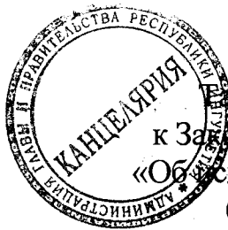
Таблица 4 приложения 3 к Закону Республики Ингушетия «Об исполнении республиканского бюджета за 2019 год»