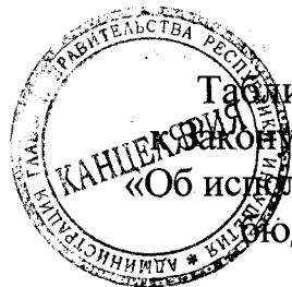
Таблица 1 приложения 10 Закона Республики Ингушетия «Об исполнении республиканского бюджета за 2019 год»