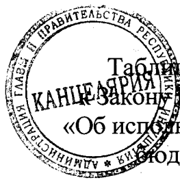
Таблица 1 приложения 11 к Закону Республики Ингушетия «Об исполнении республиканского бюджета за 2019 год»