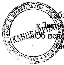
Таблица 1 приложения 9 к Закону Республики Ингушетия «Об исполнении республиканского бюджета за 2019 год»