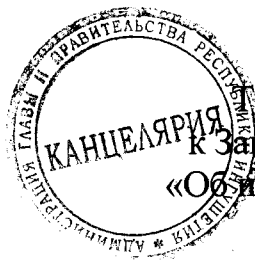
Таблица 1 приложения 20 к Закону Республики Ингушетия «Об исполнении республиканского бюджета за 2019 год»