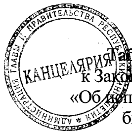
Таблица 3 приложения 3 к Закону Республики Ингушетия «Об исполнении республиканского бюджета за 2019 год»