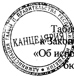
Таблица 3.1 приложения 6 к Закону Республики Ингушетия «Об исполнении республиканского бюджета за 2019 год»