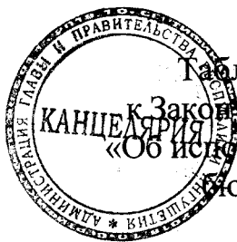
Таблица 1 приложения 3

к Закону Республики Ингушетия «Об исполнении республиканского бюджета за 2019 год»