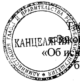
Таблица 2 приложения 2 к Закону Республики Ингушетия «Об исполнении республиканского бюджета за 2019 год»