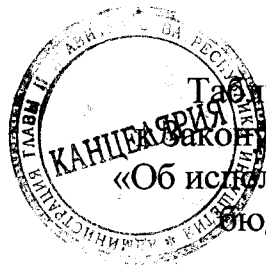
Таблица 1 приложения 7 Закона Республики Ингушетия «Об исполнении республиканского бюджета за 2019 год»