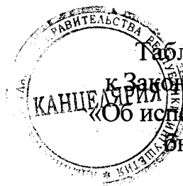
Таблица 1 приложения 19 к Закону Республики Ингушетия «Об исполнении республиканского бюджета за 2019 год»