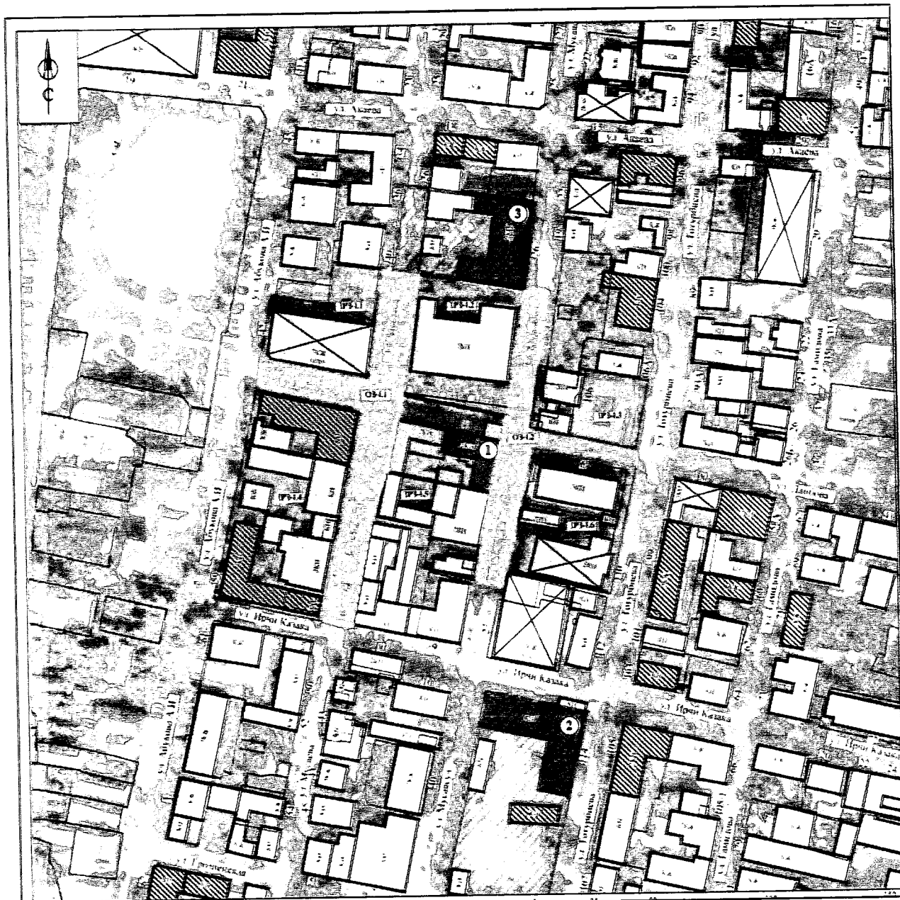
Рис.2. Карта (схема) границ зон охраны объекта культурного наследия регионального значения «Здание ГОВД (дом купца Селимгереева)», 1903 г. (Республика Дагестан, г.Хасавюрт, ул.Даибова, 4)