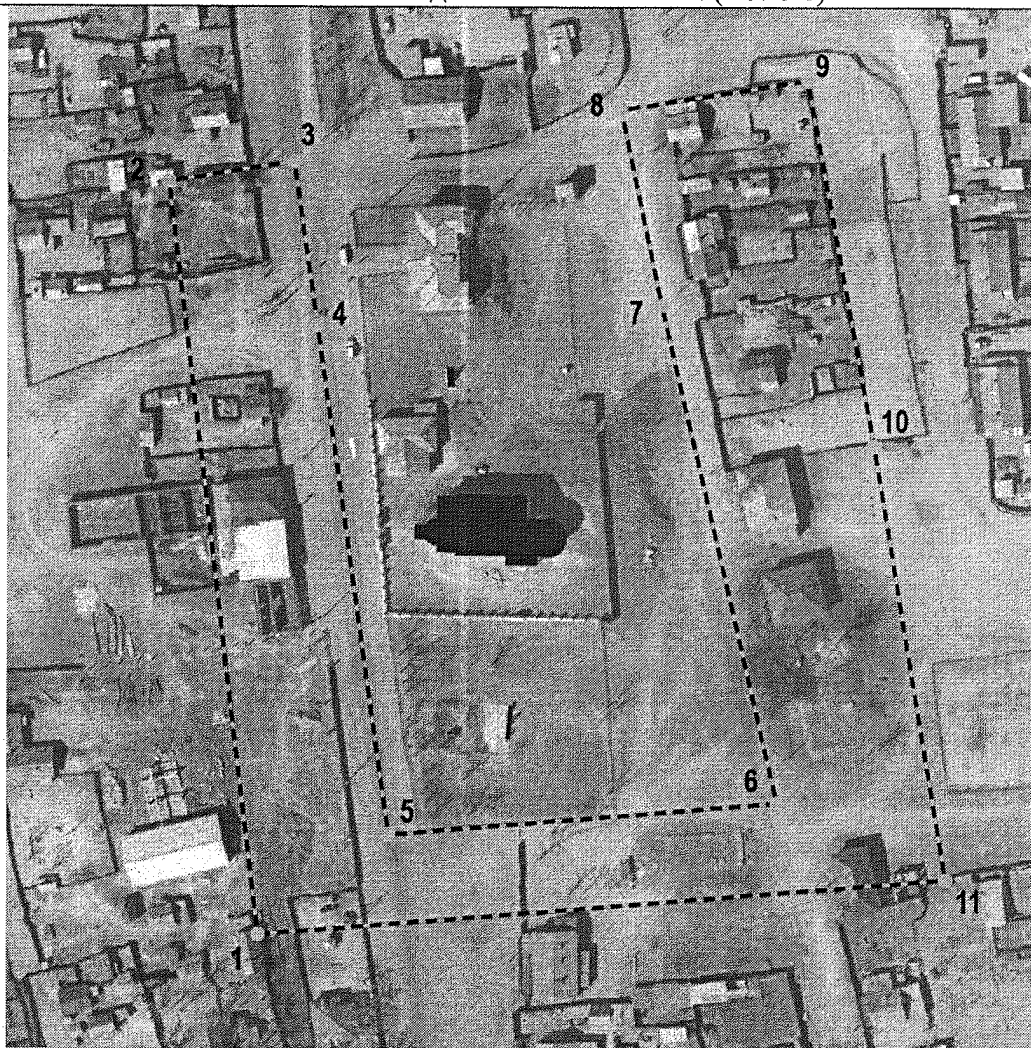
План границ единой зоны регулирования застройки и хозяйственной деятельности 1 типа (ЕЗРЗ 1)