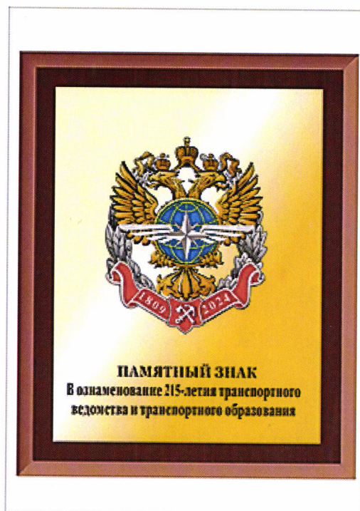
РИСУНОК памятного знака от Министра транспорта Российской Федерации «В ознаменование 215-летия транспортного ведомства и транспортного образования»