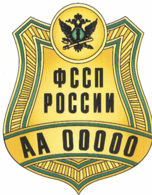
Рисунок нагрудного служебного знака судебного пристава

Приложение № 2 к приказу ФССП России от 10.01.2024 № 1