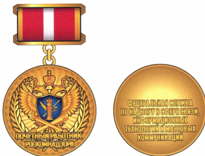
Рисунок нагрудного знака

Ширина ленты – 24 мм, ширина золотистой каймы – 2 мм.