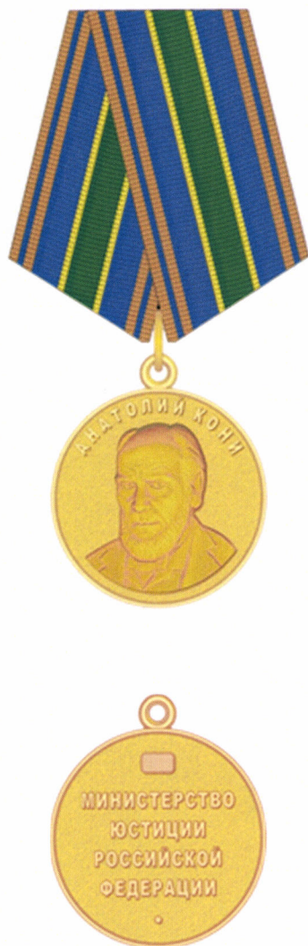
РИСУНОК медали Анатолия Кони