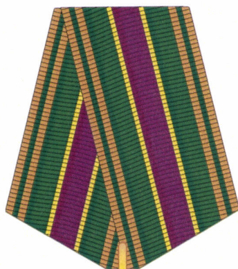
РИСУНОК медали Михаила Сперанского