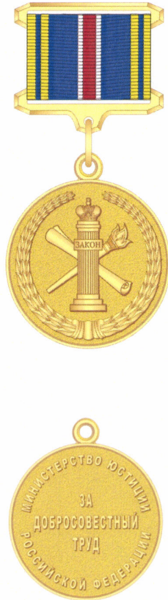
РИСУНОК медали «За добросовестный труд» I степени