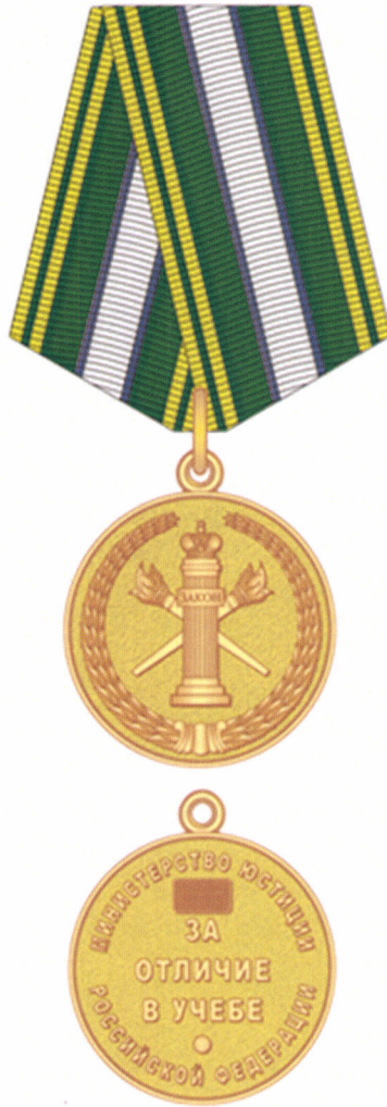
РИСУНОК медали «За отличие в учебе»