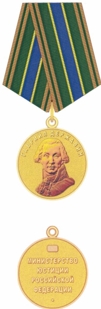
РИСУНОК медали Гавриила Державина