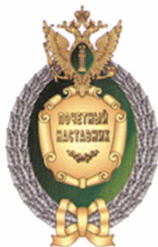
РИСУНОК нагрудного знака отличия «Почетный наставник Министерства юстиции Российской Федерации»