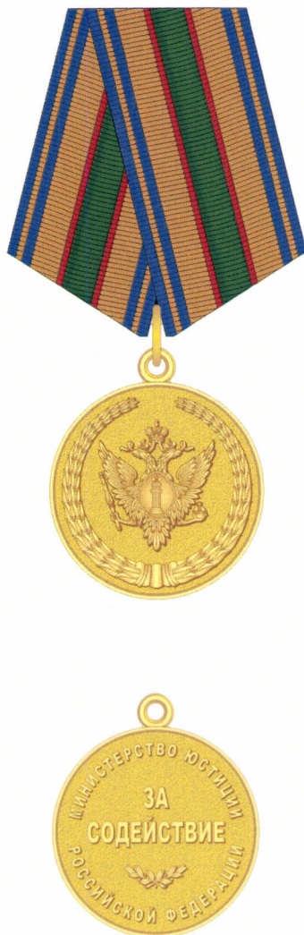
РИСУНОК золотой медали «За содействие»