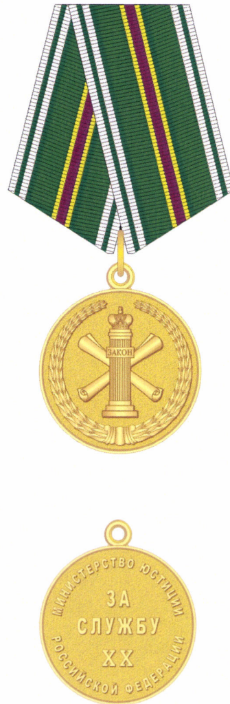
РИСУНОК медали «За службу» I степени