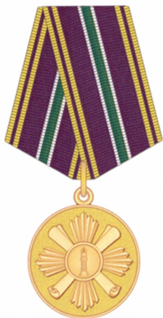
РИСУНОК медали «За отличие» I степени