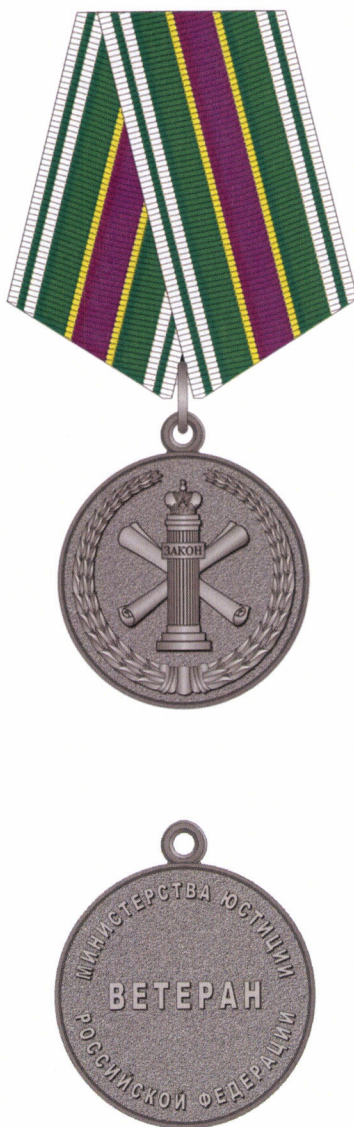
РИСУНОК медали «Ветеран Министерства юстиции Российской Федерации»