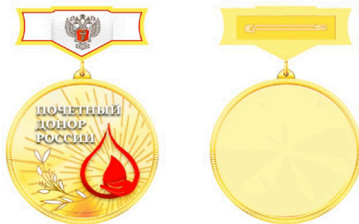
РИСУНОК нагрудного знака "Почетный донор России"