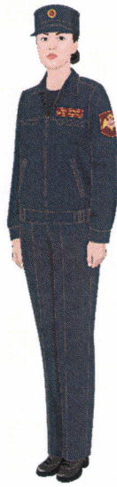
Рисунок № 23