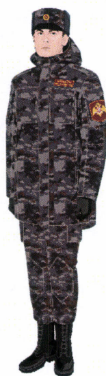
Рисунок № 5