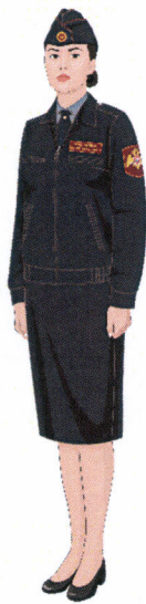
Рисунок № 22