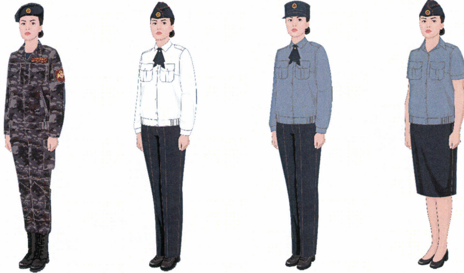
Рисунок № 25 Рисунок № 26 Рисунок № 27 Рисунок № 28

Рисунок № 24 (В кепи летнем повседневном темно-синего цвета, в костюме летнем повседневном (куртке и юбке) темно-синего цвета, футболке типа «А» с длинными рукавами, туфлях хромовых).