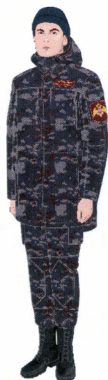
Рисунок № 32

Рисунок № 31 (В кепи летнем повседневном темно-синего цвета, брюках из костюма летнего повседневного темно-синего цвета, свитере полушерстяном типа «А», полуботинках хромовых).