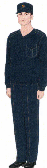
Рисунок № 31

Рисунок № 29 (В шапке вязаной трикотажной, куртке демисезонной с поясом темно-синего цвета, брюках из костюма летнего повседневного темно-синего цвета, ботинках летних, кашне).