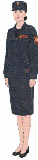
Рисунок № 24

Рисунок № 21 (В пилотке полушерстяной, куртке полушерстяной и брюках полушерстяных, блузке серо-голубого цвета с длинными рукавами, галстук женском «Бант», ботинках летних).