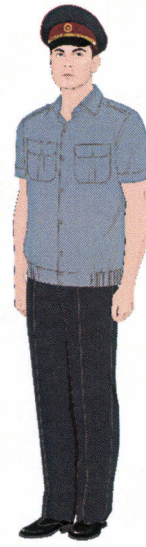
Рисунок № 17 Рисунок № 18 Рисунок № 19 Рисунок № 20