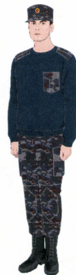
Рисунок № 34