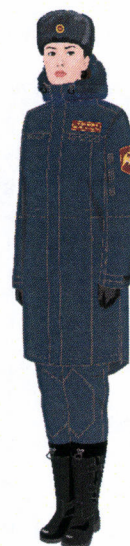
Рисунок № 9

Рисунок № 7 (В шапке-ушанке меховой из овчины, куртке зимней с поясом темно-синего цвета, полукомбинезоне зимнем темно-синего цвета, перчатках полушерстяных, ботинках зимних).