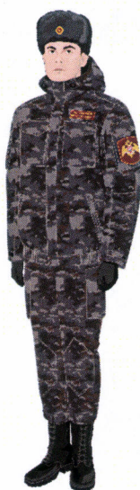
Рисунок № 4

Рисунок № 3 (В шапке-ушанке меховой из овчины, куртке зимней удлиненной для местности с холодным климатом темно-синего цвета, полукombineзоне для местности с холодным климатом темно-синего цвета, рукавицах трехпалых комбинированных, сапогах утепленных комбинированных для местностей с холодным климатом).