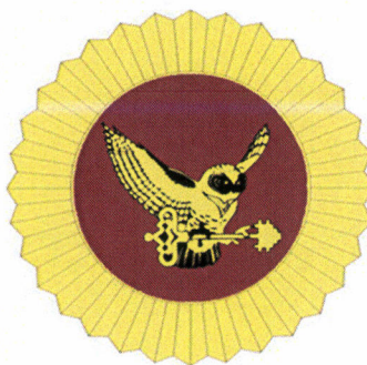
Рисунок № 41

1.13.2. Нарукавный знак в виде контурного щита из ткани бордового цвета (цвет по Pantone C30 M100 Y100 K40), декорированный по периметру тесьмой желтого цвета. В центре знака располагается геральдический знак – эмблема войск национальной гвардии Российской Федерации 1 . Размер знака 90 x 70 мм. Нарукавный знак размещается на куртках от костюма летнего повседневного, куртке зимней и куртке демисезонной на внешней стороне левого рукава на расстоянии 80 мм от его верхней точки (рисунок № 42).