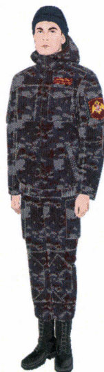
Рисунок № 33