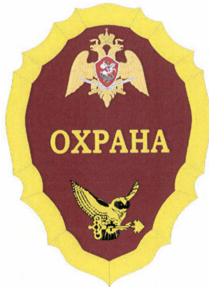
Рисунок № 46

Жетон представляет собой фигурный конусный картуш бордового цвета (цвет по Pantone C30 M100 Y100 K40), обрамленный лентой желтого цвета, в верхней части которого помещен геральдический знак – эмблема войск национальной гвардии Российской Федерации. Под изображением геральдического знака – эмблемы войск национальной гвардии Российской Федерации помещена рельефная надпись «ОХРАНА» желтого цвета. Внизу жетона помещен элемент товарного знака ФГУП «Охрана» Росгвардии желтого цвета – изображение совы, держащей в лапах ключ. Размер жетона 85 x 60 мм. Крепление жетона к одежде – на булавке типа «карабин». Жетон размещается на куртке от костюма летнего повседневного, рубашке или блузке с длинными или короткими рукавами при ношении без куртки на левой стороне груди при летней форме одежды или в помещении (рисунок № 46).