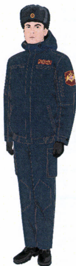
Рисунок № 1