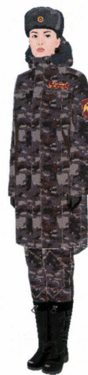
Рисунок № 12

Рисунок № 10 (В шапке-ушанке меховой из овчины, куртке зимней с поясом камуфлированной расцветки, полукомбинезоне зимнем