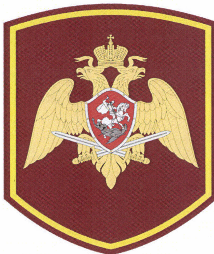
Рисунок № 42

1.13.2. Нарукавный знак в виде контурного щита из ткани бордового цвета (цвет по Pantone C30 M100 Y100 K40), декорированный по периметру тесьмой желтого цвета. В центре знака располагается геральдический знак – эмблема войск национальной гвардии Российской Федерации 1 . Размер знака 90 x 70 мм. Нарукавный знак размещается на куртках от костюма летнего повседневного, куртке зимней и куртке демисезонной на внешней стороне левого рукава на расстоянии 80 мм от его верхней точки (рисунок № 42).