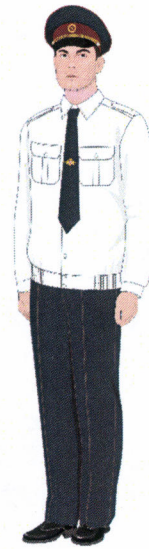
Рисунок № 13 Рисунок № 14 Рисунок № 15 Рисунок № 16

Рисунок № 13 (В фуражке полушерстяной, куртке полушерстяной темно-синего цвета, брюках полушерстяных темно-синего цвета, рубашке серо-голубого цвета с длинными рукавами, галстукe, ботинках летних).