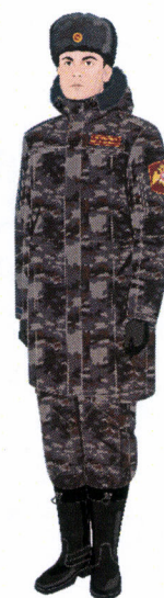
Рисунок № 6

Рисунок № 4 (В шапке-ушанке меховой из овчины, куртке зимней с поясом камуфлированной расцветки, полукombineзоне зимнем камуфлированной расцветки, перчатках полушерстяных, ботинках с высокими берцами зимних).