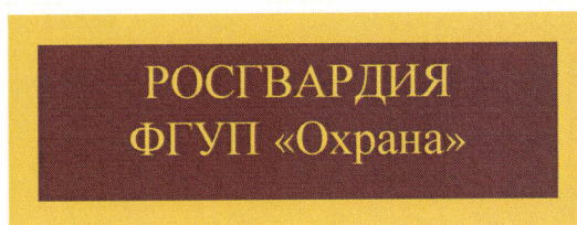
Рисунок № 44

1.13.4. Нашивка на карман в виде прямоугольника из ткани бордового цвета, декорированная по периметру тесьмой желтого цвета. По центру в два ряда расположена надпись «РОСГВАРДИЯ ФГУП «Охрана» желтого цвета. Размер знака 120 x 38 мм. Располагается на куртке от костюма летнего повседневного, куртке полушерстяной, куртке зимней, куртке демисезонной, жилете разгрузочном впереди над левым карманом (рисунок № 44).