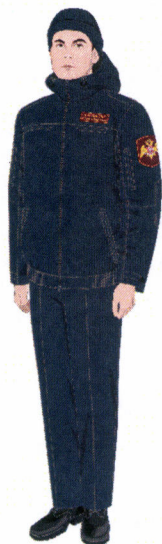
Рисунок № 29

куртка демисезонная с поясом темно-синего цвета или камуфлированной расцветки или куртка демисезонная удлиненная темно-синего цвета или камуфлированной расцветки; свитер полушерстяной типа «А» или типа «Б»; кашне.