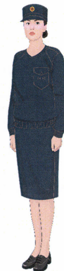
Рисунок № 37

Рисунок № 35 (В шапке вязаной трикотажной, куртке демисезонной с поясом темно-синего цвета, юбке из костюма летнего повседневного темно-синего цвета, полуботинках хромовых, кашне).