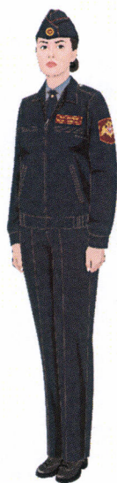
Рисунок № 21