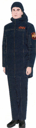
Рисунок № 30