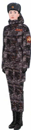
Рисунок № 10

Рисунок № 9 (В шапке-ушанке меховой из овчины, куртке зимней удлиненной для местности с холодным климатом камуфлированной расцветки, полукомбинезоне для местности с холодным климатом камуфлированной расцветки, рукавицах трехпалых комбинированных, сапогах утепленных комбинированных для местности с холодным климатом).