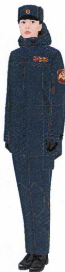
Рисунок № 8