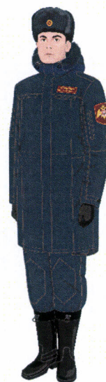
Рисунок № 3

Рисунок № 1 (В шапке-ушанке меховой из овчины, куртке зимней с поясом темно-синего цвета, полукombineзоне зимнем темно-синего цвета, перчатках полушерстяных, ботинках зимних).