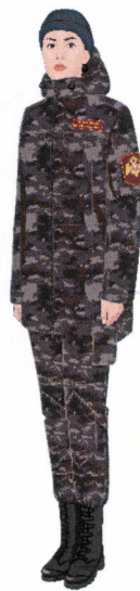
Рисунок № 39