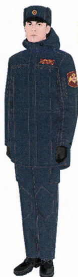
Рисунок № 2