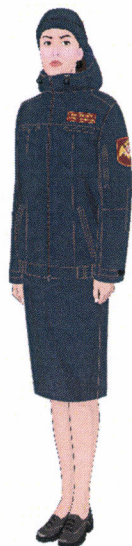
Рисунок № 35