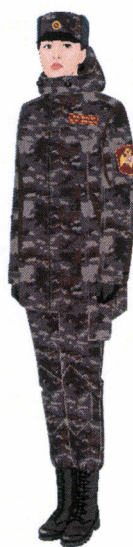
Рисунок № 11