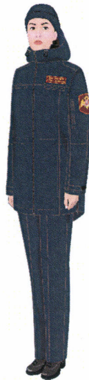
Рисунок № 36