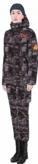
Рисунок № 38

Рисунок № 37 (В кепи летнем повседневном темно-синего цвета, свитере полушерстяном типа «А», юбке из костюма летнего повседневного темно-синего цвета, полуботинках хромовых).