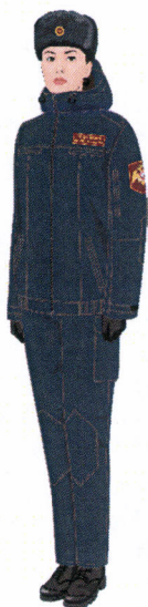
Рисунок № 7