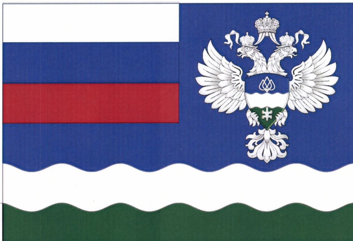
Рисунок флага Федерального агентства водных ресурсов

Приложение № 5 к приказу Минприроды России от 20.07.2022 № 488