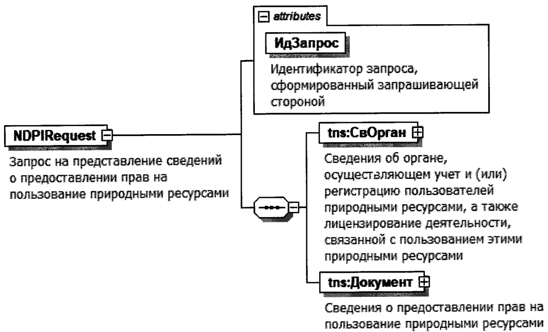
Рисунок 1. Диаграмма структуры документа обмена