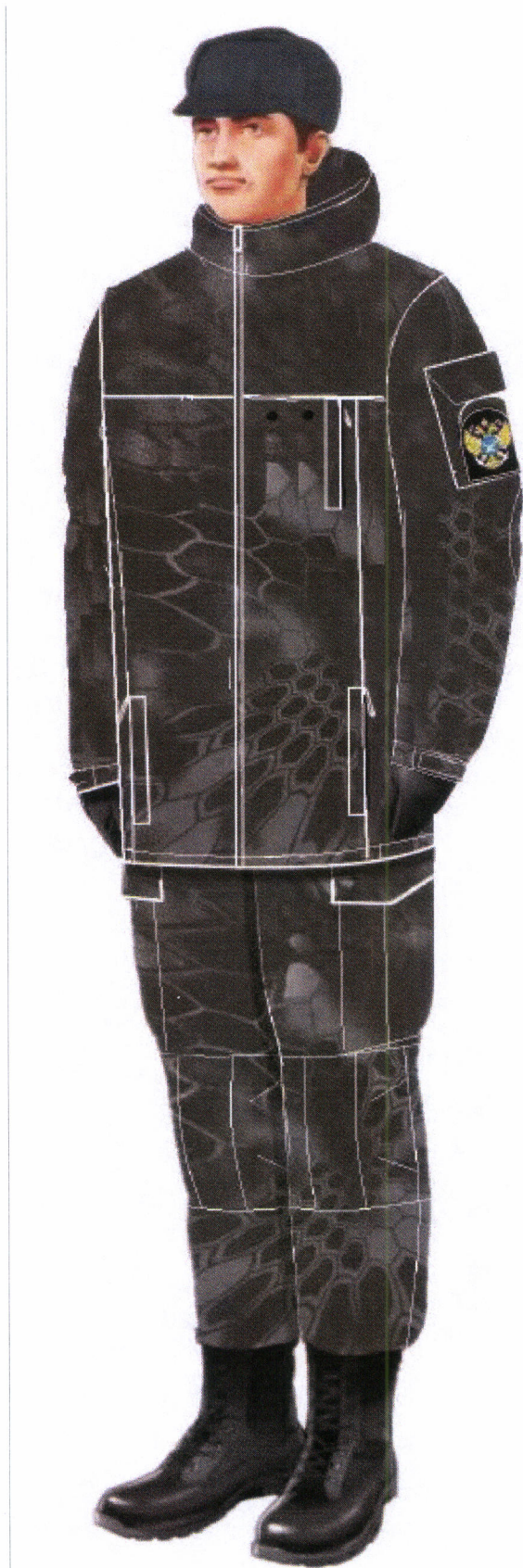
Рис. 19.3. Костюм ветровлагозащитный (куртка, брюки)