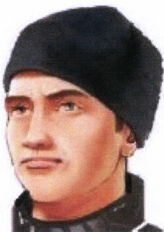
Рис. 21.1. Шапка флисовая