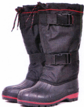
Рис. 21.10. Бахилы рыбацкие, зимние