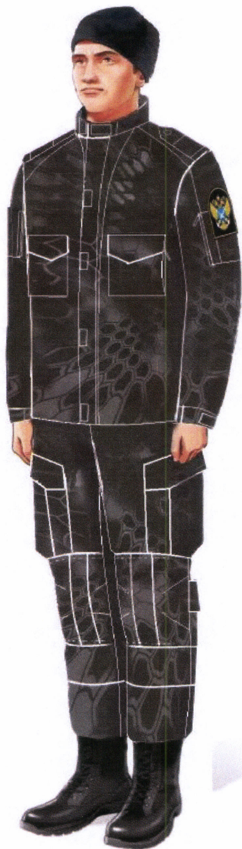
Рис. 19.1. Костюм специальный летний (куртка, брюки)