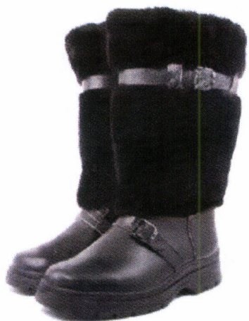
Рис. 21.7. Унты меховые