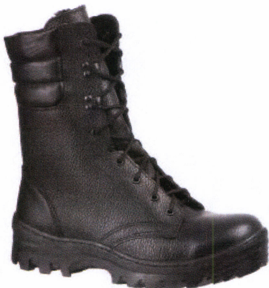
Рис. 21.5. Берцы специальные летние, зимние