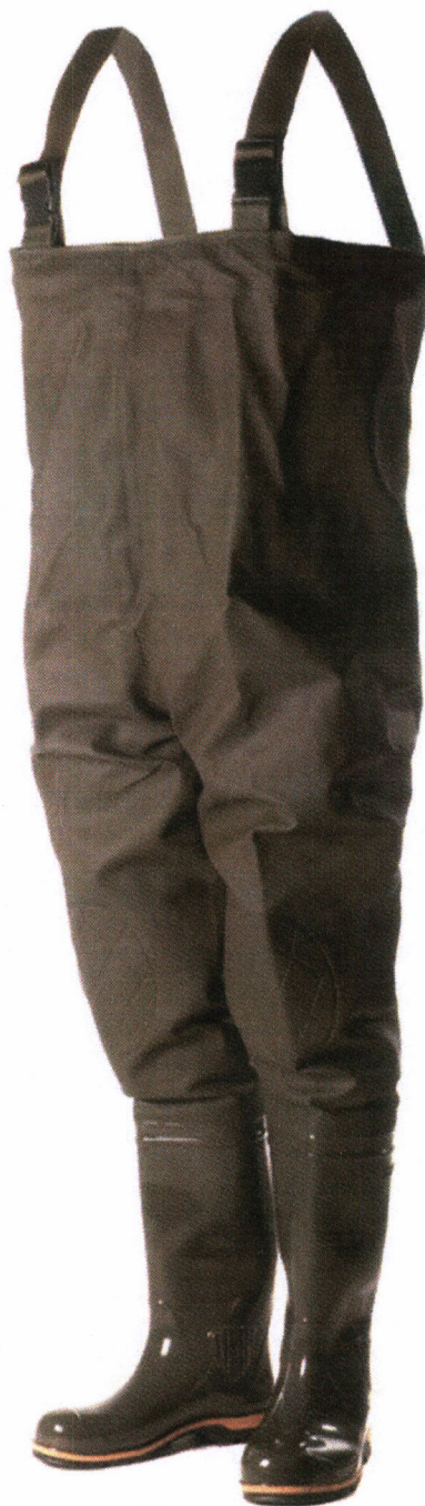
Рис. 21.8. Полукомбинезон