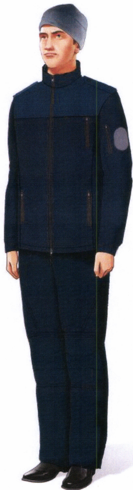
Рис. 19.5. Куртка флисовая