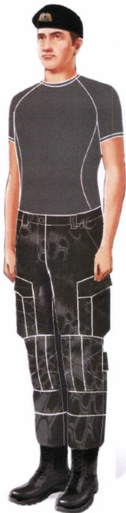
Рис. 20.2. Футболка анатомическая