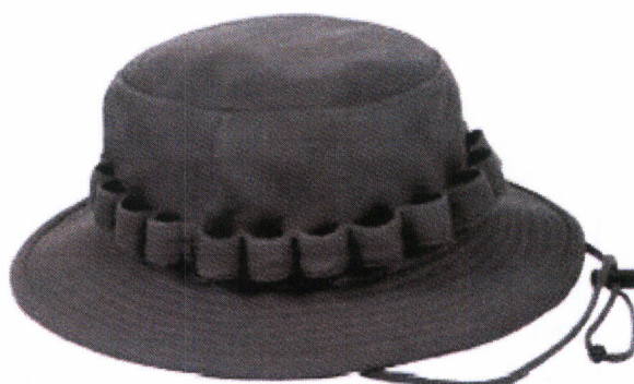
Рис. 21.4. Панама с москитной сеткой