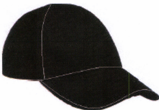
Рис. 21.3. Бейсболка летняя и демисезонная