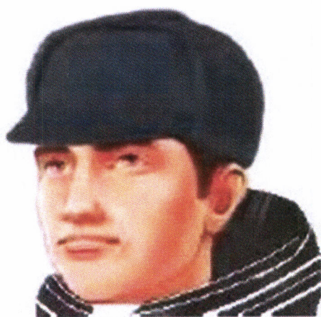
Рис. 21.2. Шапка зимняя