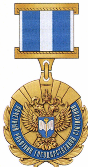
РИСУНОК нагрудного знака к почетному званию «Почетный работник государственной статистики»

«Приложение № 2 к Положению о почетном звании «Почетный работник государственной статистики», утвержденному приказом Росстата от 25.10.2018 № 635