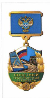
РИСУНОК нагрудного знака «Почетный транспортный строитель»

На оборотной стороне колодки имеется приспособление для крепления нагрудного знака к одежде.