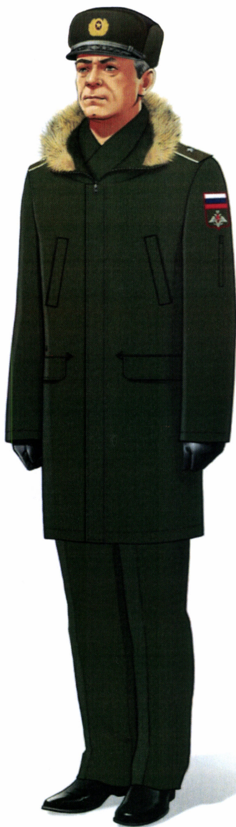
Рис. Зимняя повседневная форма одежды действительных государственных советников Российской Федерации и государственных советников Российской Федерации 1 класса