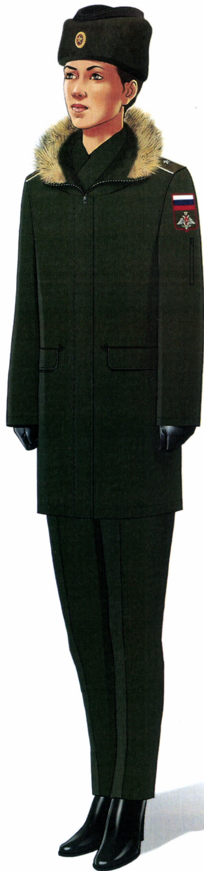
Рис. Зимняя повседневная форма одежды действительных государственных советников Российской Федерации и государственных советников Российской Федерации 1 класса»;