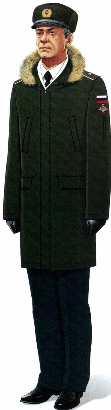
Рис. Зимняя парадная форма одежды действительных государственных советников Российской Федерации и государственных советников Российской Федерации 1 класса