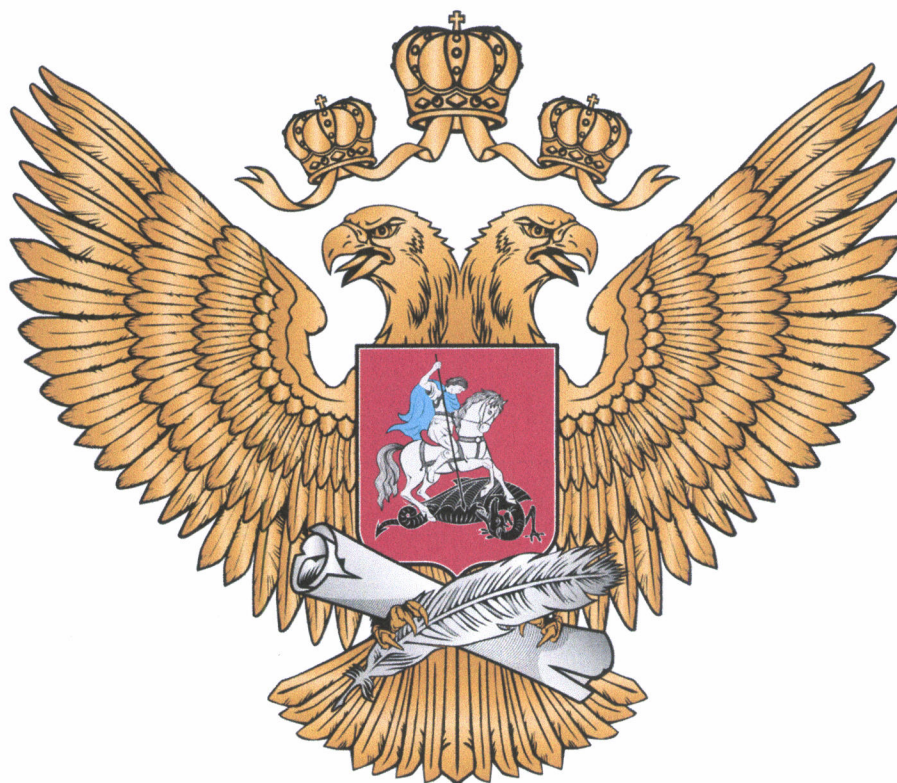
Рисунок геральдического знака – малой эмблемы Министерства просвещения Российской Федерации