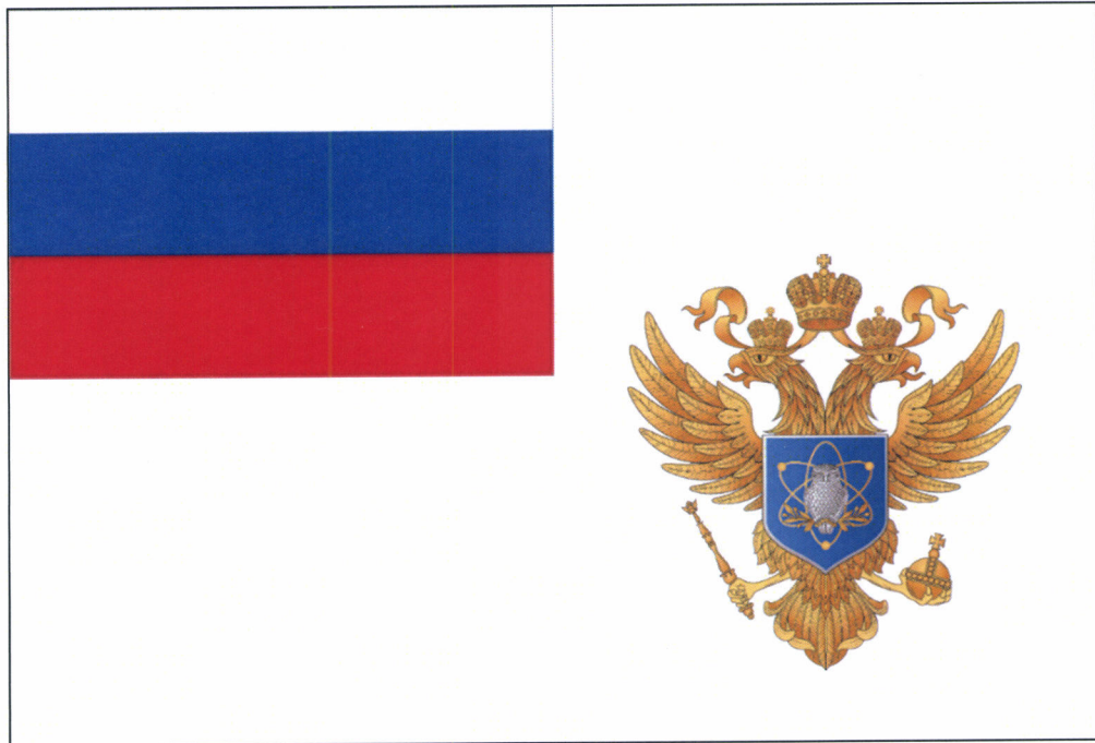
Рисунок флага Министерства науки и высшего образования Российской Федерации