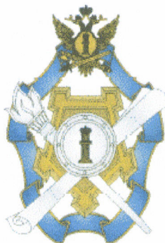
Рисунок нагрудного знака "Лучший работник учреждений и органов, исполняющих наказания, не связанные с изоляцией осужденных от общества"