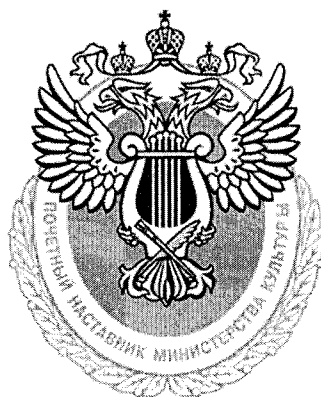
Рисунок ведомственного знака отличия Министерства культуры Российской Федерации «Почетный наставник»

Ведомственный знак отличия Министерства культуры Российской Федерации «Почетный наставник» представляет собой рельефное изображение геральдического знака – эмблемы Министерства культуры Российской Федерации: двуглавый орел с поднятыми распущенными крыльями, увенчанный двумя малыми коронами и над ними – одной большой короной, соединенными лентами. На груди орла – щит, края которого окаймляют серебряную лиру. На нижней части лиры – перекрещенные диагонально кисть и перо. По нижнему краю знака надпись: «ПОЧЕТНЫЙ НАСТАВНИК МИНИСТЕРСТВА КУЛЬТУРЫ».