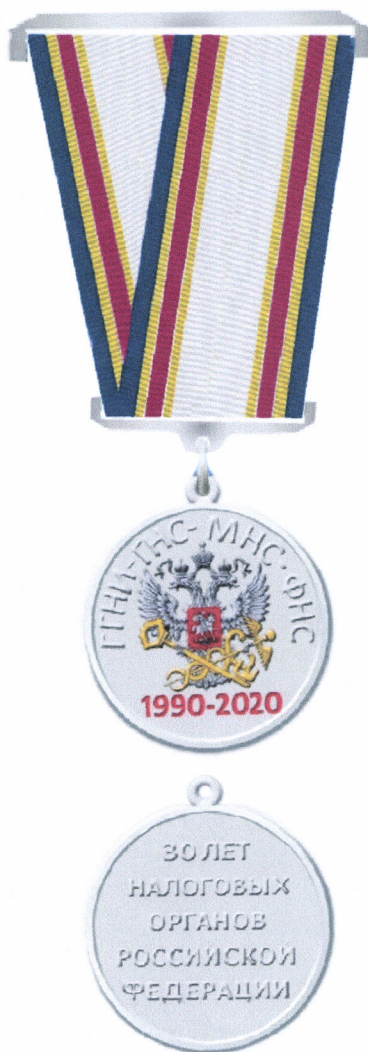
РИСУНОК памятной медали Федеральной налоговой службы «30 лет налоговых органов Российской Федерации»

Приложение № 2 к Положению о памятной медали Федеральной налоговой службы «30 лет налоговых органов Российской Федерации», утвержденному приказом ФНС России от «10» 02 2020 г. № Ев-7-4/86 @