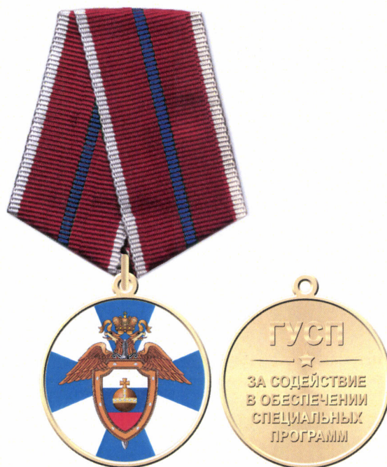
Рисунок медали «За содействие в обеспечении специальных программ»