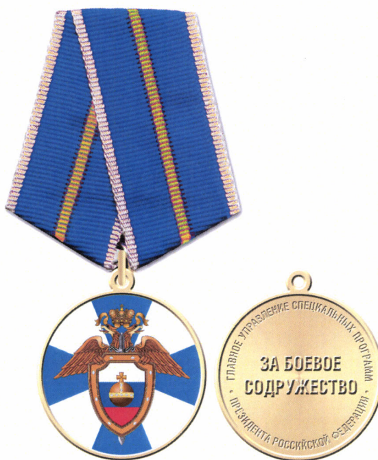
Рисунок медали «За боевое содружество»