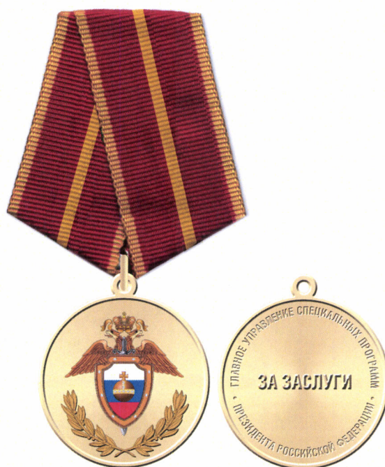
Рисунок медали «За заслуги»