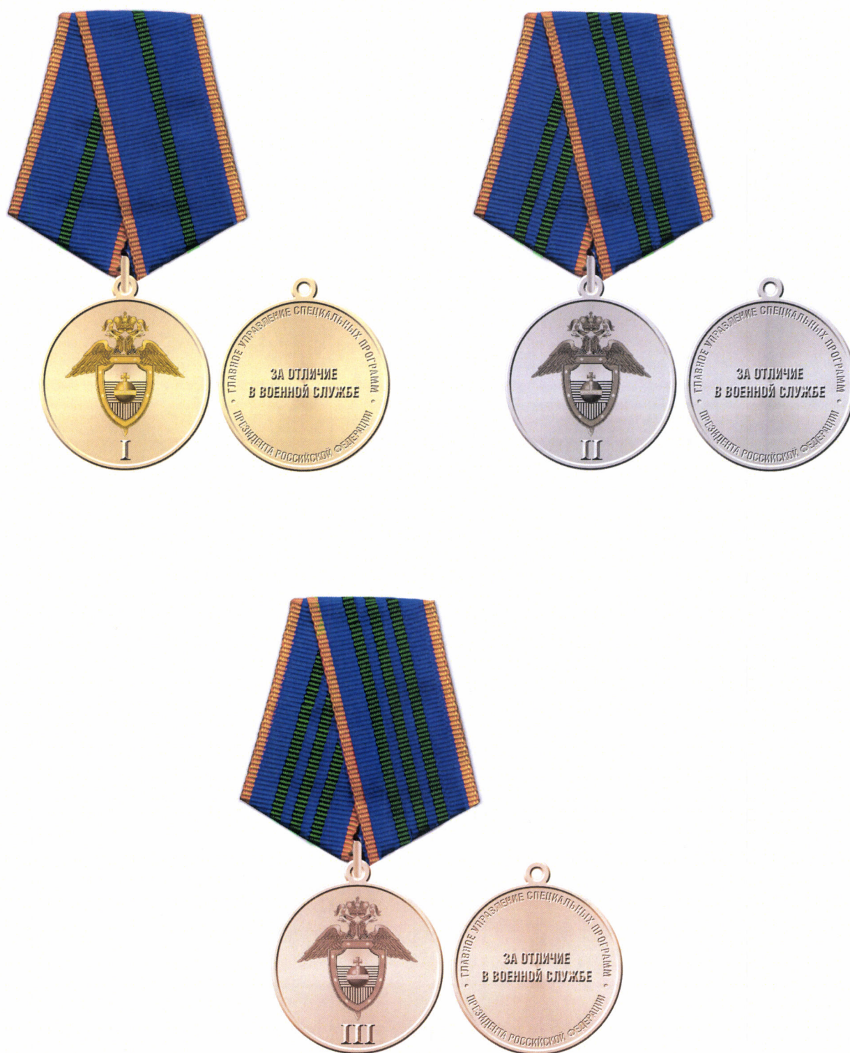
Рисунок медали «За отличие в военной службе»