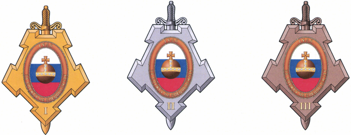
Рисунок нагрудного знака «За службу на спецобъектах»