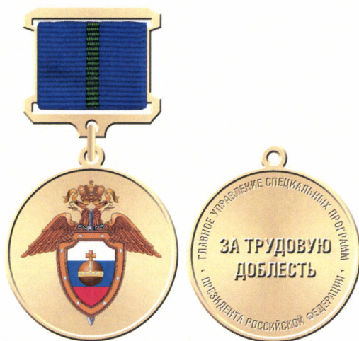
Рисунок медали «За трудовую доблесть»