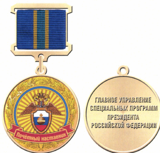
Рисунок нагрудного знака «Почетный наставник»