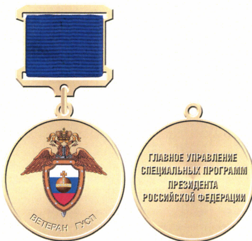
Рисунок медали «Ветеран Главного управления специальных программ Президента Российской Федерации»