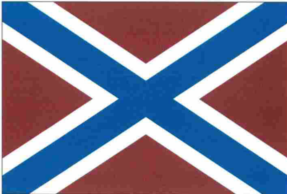
РИСУНОК флага кораблей, катеров и судов войск национальной гвардии Российской Федерации

УТВЕРЖДЕН Указом Президента Российской Федерации от 30 декабря 2019 г. № 637