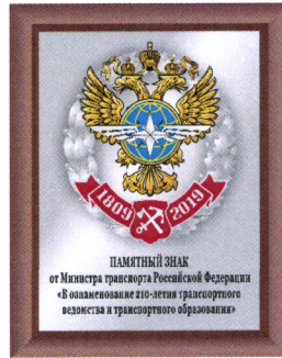
РИСУНОК памятного знака от Министра транспорта Российской Федерации «В ознаменование 210-летия транспортного ведомства и транспортного образования»