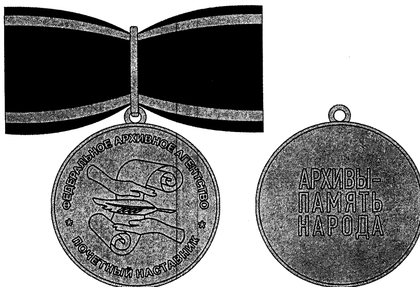
РИСУНОК ВЕДОМСТВЕННОГО ЗНАКА ОТЛИЧИЯ ФЕДЕРАЛЬНОГО АРХИВНОГО АГЕНТСТВА «ПОЧЕТНЫЙ НАСТАВНИК»