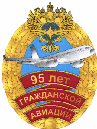
РИСУНОК памятного знака «95 лет гражданской авиации»

Памятный знак порядковый номер не имеет.