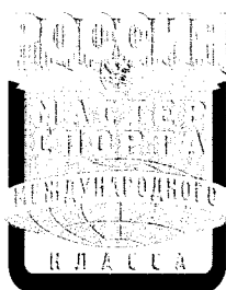
Рисунок нагрудного знака «мастер спорта России международного класса»