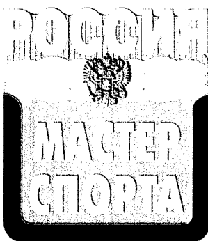
Рисунок нагрудного знака «мастер спорта России»

Описание нагрудного знака «мастер спорта России»