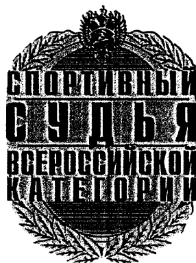
Рисунок нагрудного знака «спортивный судья всероссийской категории»

Описание нагрудного знака «спортивный судья всероссийской категории»