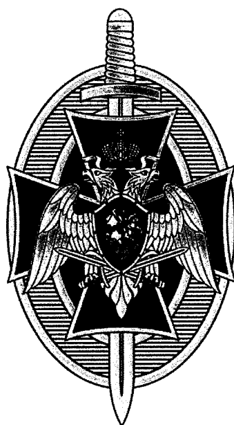
РИСУНОК нагрудного знака к почетному званию «Почетный сотрудник Росгвардии»

Приложение № 2 к Положению о почетном звании «Почетный сотрудник Росгвардии»