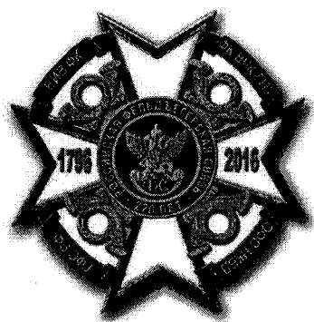
РИСУНОК ведомственного знака отличия – памятного знака Государственной фельдъегерской службы Российской Федерации «220 лет Российской фельдъегерской связи»

к приказу ГФС России от « 02 » августа 2016 г. № 241