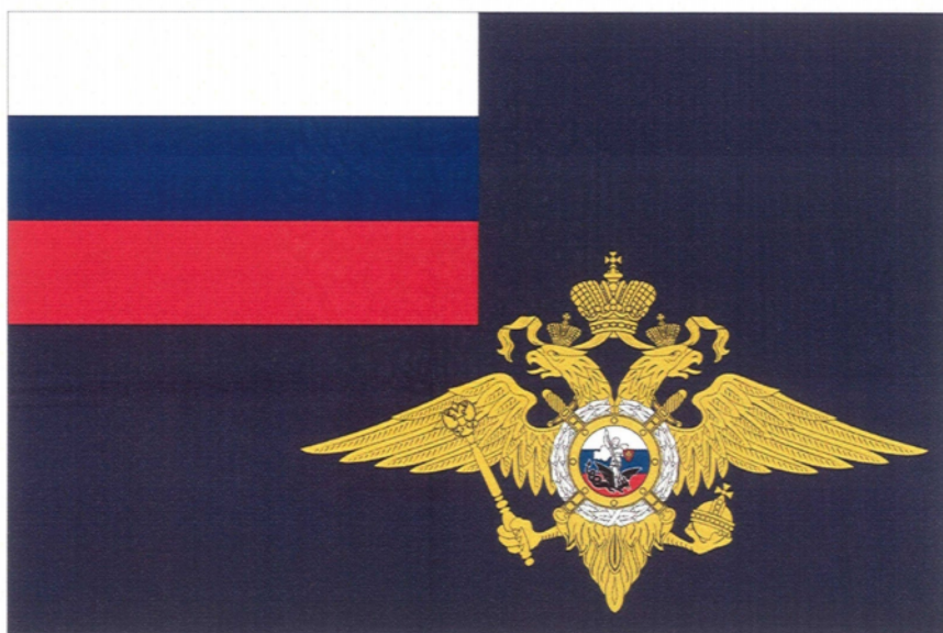
РИСУНОК флага Министерства внутренних дел Российской Федерации

Указом Президента Российской Федерации от 12 июля 2012 г. № 983