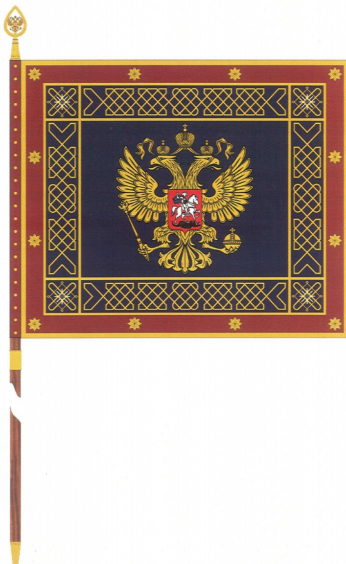
РИСУНОК знамени Министерства внутренних дел Российской Федерации

Указом Президента Российской Федерации от 12 июля 2012 г. № 983