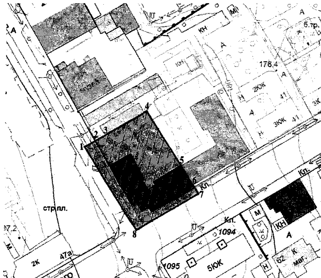
Схема (графическое описание местоположения) границ территории объекта культурного наследия регионального значения «Жилой дом», Курская область, г.Курск, ул. Дзержинского, 43